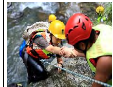
親水溯溪挑戰之旅

新北插角路線……夥伴學校高雄瑞豐國小、台南建功國小、花蓮志學國小至新北插角國小實地交流行程，四校學生約120人參與活動。