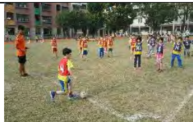
學習團隊合作展現團 隊默契