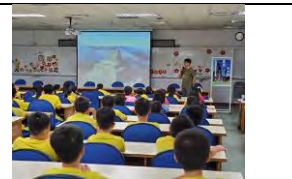
雪羊老師登山講座—「邁 向山林的第一小步」