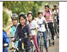
走讀在地文史體驗 健康活動