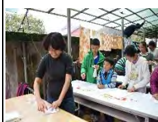
體驗染布教學活動