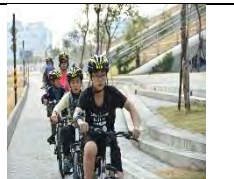
認識自行車騎乘 技術要訣