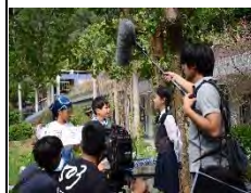
認識板根森林生態環境